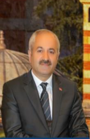
Zinnur BÜYÜKGÖZ BELEDİYE BAŞKANI